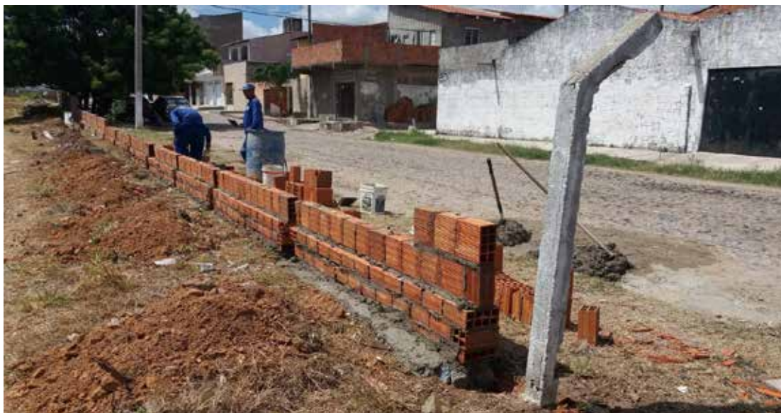
Figura 2 - Vista da fase inicial de construção da mureta com estaca

De acordo com HANNAD et al. (2013), estima-se que a cada litro de água utilizada para produção de 1 m 3 de concreto ou similares (reboco, chapisco, argamassa de assentamento, dentre outros) utiliza-se cerca de 2,65 vezes mais água para tarefas periféricas, tais como: lavagem de agregados, limpeza de materiais/equipamentos, umectação de poeira em suspensão e cura. Logo, o volume estimado utilizado de água de reúso na obra de reforma da ETE Guadalajara foi de 23,77 m 3 . As Figuras 2, 3 e 4 a seguir apresentam a execução da mureta da Estação de Tratamento de Esgoto Guadalajara, onde foram utilizadas amostras coletadas da mesma estação após parecer favorável das análises realizadas.