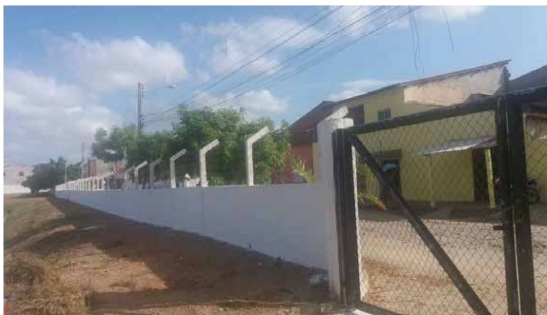
Figura 4 - Vista da mureta interna concluída