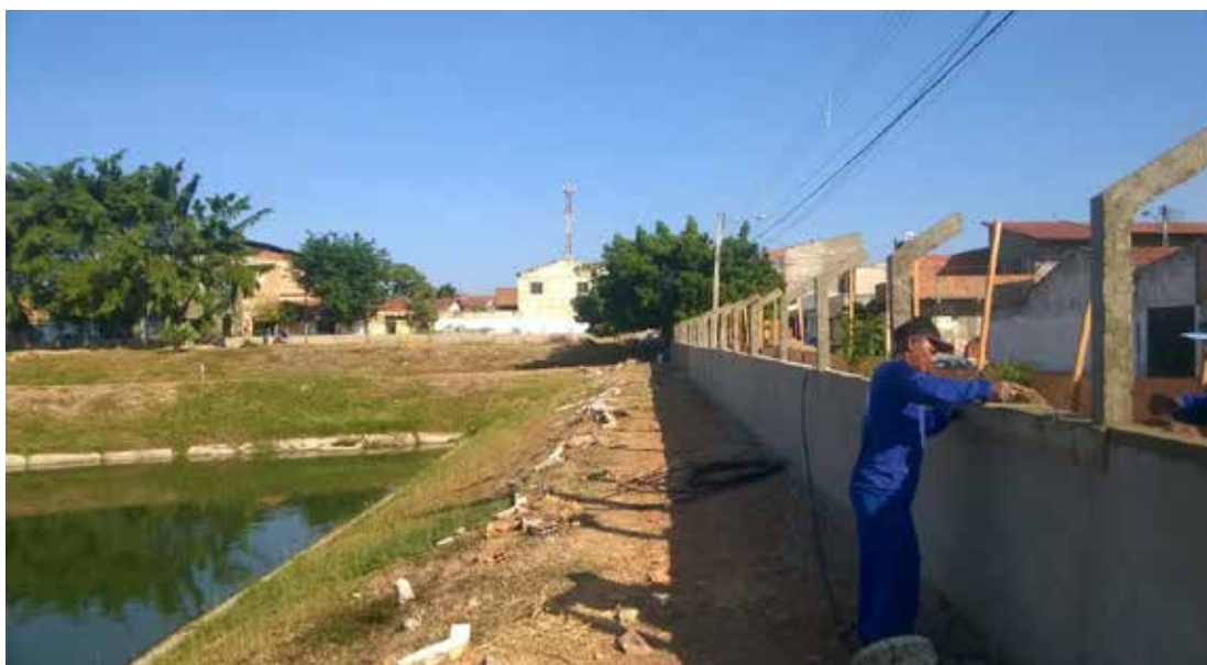
Figura 3 - Vista da fase final de construção da mureta com estaca