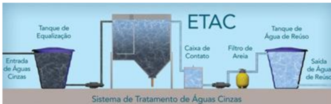
Figura 1 – Sistema de tratamento da ETAC.